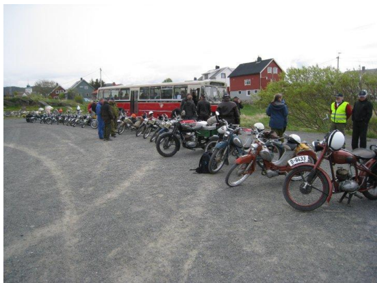
Utstilling i Bud

Vi hadde avtale med NRK, slik at vi måtte vente en stund på journalisten derfra. Når han var ankommet, og noen småproblemer med sykler var løst eller forsøkt løst, dro vi på sjarmtur i Bud sentrum. Det var rene 17. mai-stemningen i sentrum med folk langs gata, vinkende, smilende og fotograferende. Trafikken ble stanset for å slippe oss fram, og vi satte kursen utover mot havet.